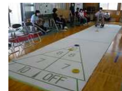
スポーツ交流会 （シャフルボード大会）