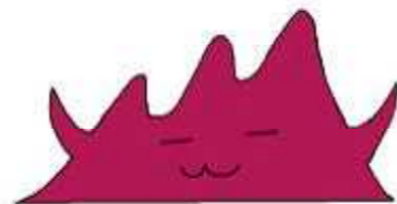
本校のマスコットキャラクター 「あかのん」