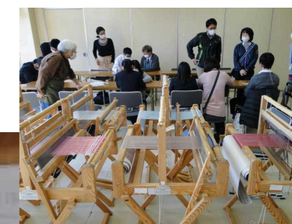
校外施設見学（かみつけの里博物館）