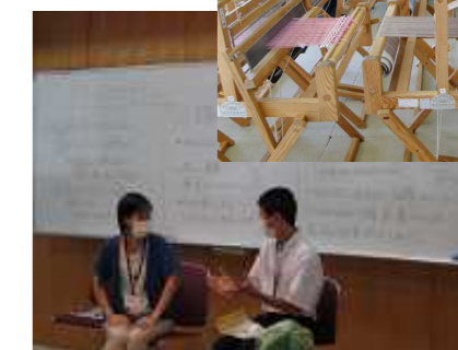
講演会（自分の思いを伝えるワークショップ）

次の場合に、高等部への入学及び転入学ができます（高等部は前橋上小出校舎のみ設置）。 ● 医師の指示により長期間生活規制を必要とし、家庭又は入院中の病院から通学できる場合。 ● 群馬大学医学部附属病院に入院していて、通学又はベッドでの学習が可能な場合。 ※転入学については在籍している高等学校と事前によく相談してください。 ※群馬大学医学部附属病院以外に入院していて、転入学を希望する場合は事前にご相談ください。