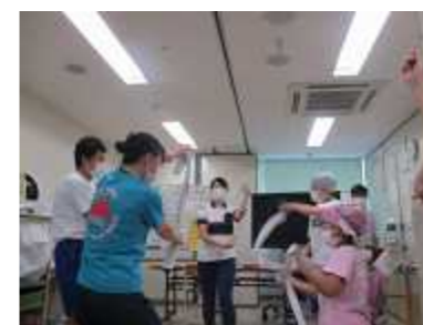
体育（八木節踊りの練習）