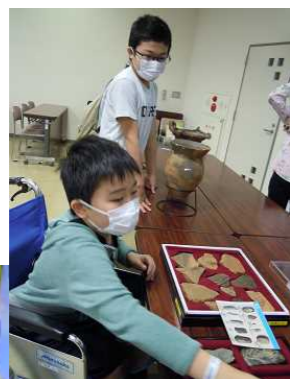
校外施設見学（埋蔵文化センター）