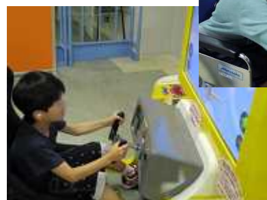
校外施設見学（科学館体験）