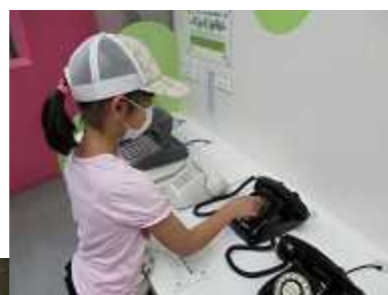
校外施設見学（科学館体験）