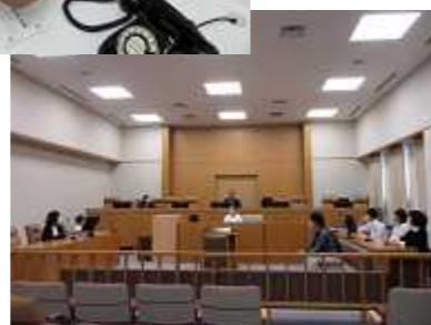
校外施設見学（前橋地方裁判所）