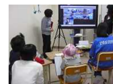
合同特別活動 （テレビ会議システムの活用）